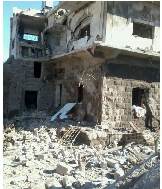
Foto von einem der Interviewpartner: Überreste seines Wohnhauses nach einem Fassbombenangriff.

Selbst wenn sie es geschafft haben, vor dem Konflikt zu fliehen, sehen sich syrische Geflüchtete vielerlei Unsicherheiten und katastrophalen Lebensbedingungen gegenüber, vor allem im Lebensunterhalt und der Gesundheitsversorgung. Generell betonten die Befragten, wie sehr der Einsatz von explosiven Waffen in Wohngebieten jeden Bereich ihres alltäglichen Lebens beeinflusste, ihre Schutzbedürftigkeit noch verstärkte und ihre Zukunft bedrohte.